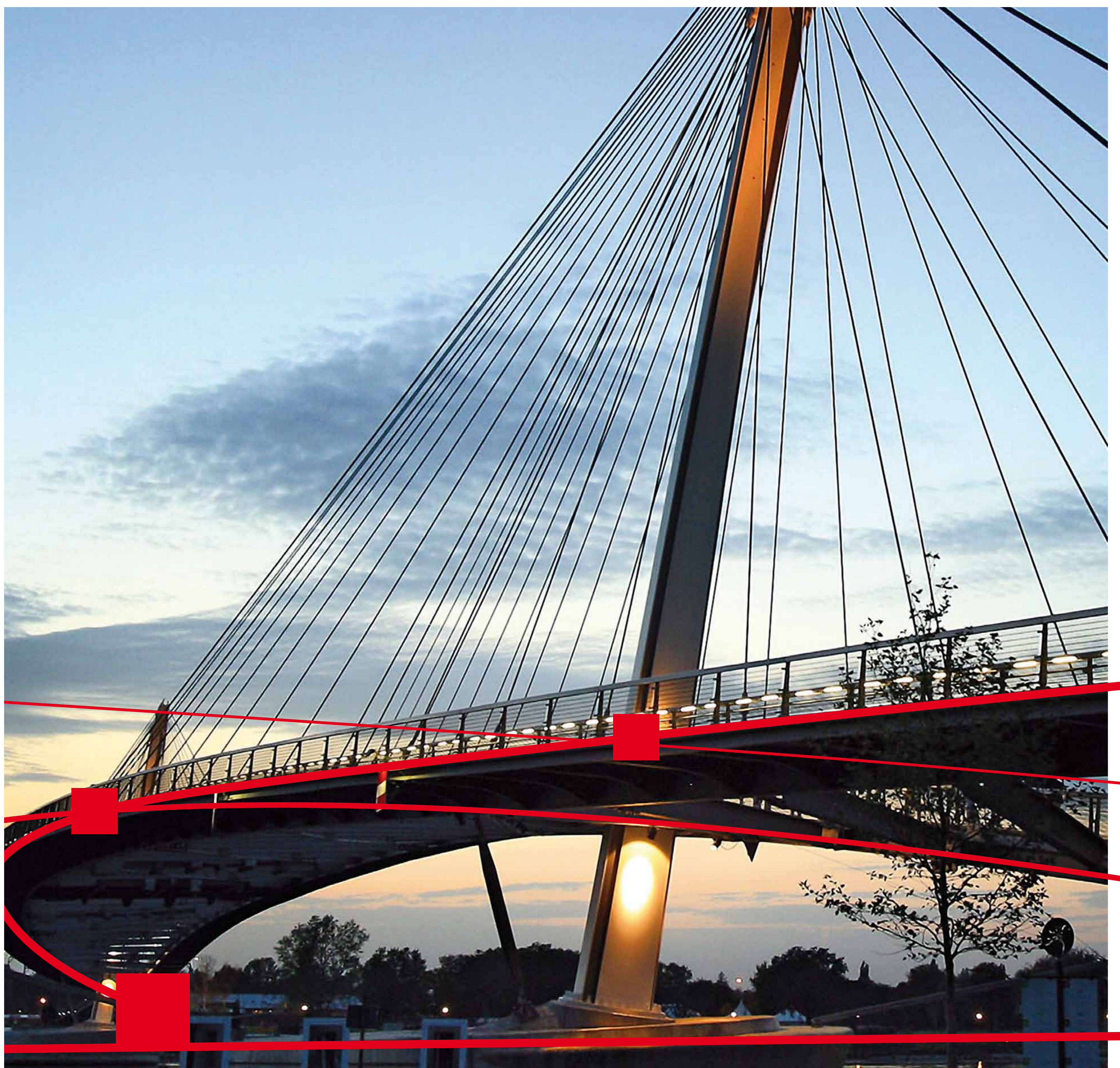
Passerelle des deux Rives zwischen Kehl und Straßburg