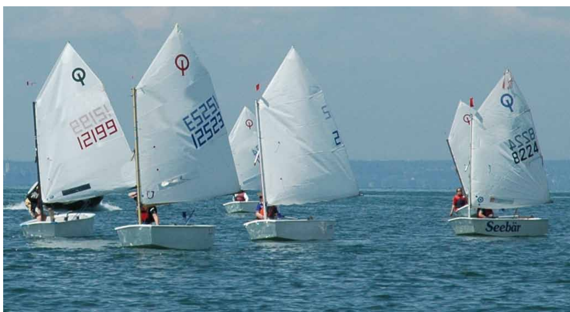
Grenzenlos segeln auf dem Bodensee (Harald Winkelhausen)

Grenzregionen mit Potenzial für Wachstum und Innovation spielen eine besondere Rolle im Netz der europäischen Stadt- und Metropolregionen. Sie stärken die europäische Wirtschaftskraft und sind gleichzeitig Labore für das Zusammenwachsen Europas. Metropolitane Grenzregionen sind vielfältige und zukunftsfähige Lebens-, Wirtschafts- und Kulturräume – sie sind das „Europa im Kleinen“.