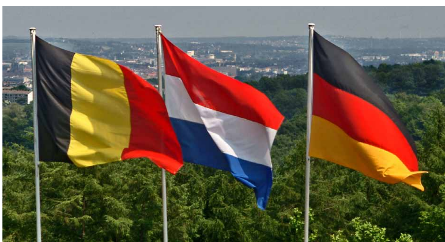
Blick vom Dreiländerpunkt in Vaals Richtung Aachen